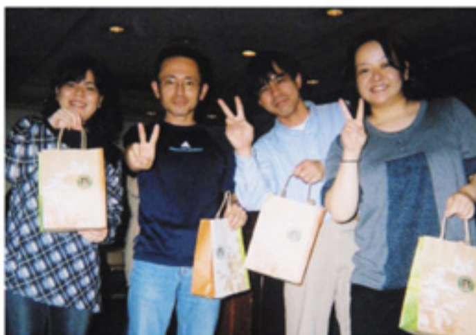
やったね! チーム優勝だ!