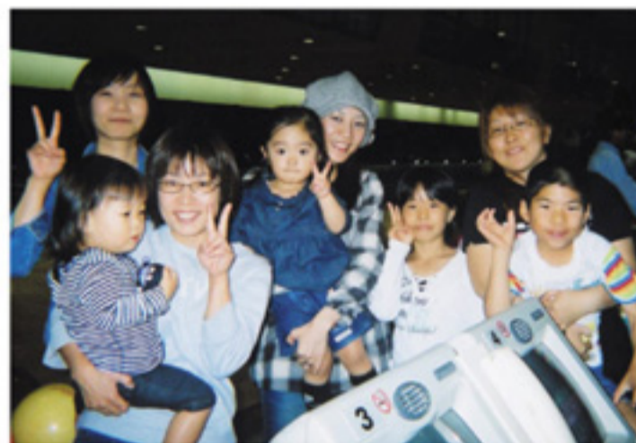
子供達も一緒に楽しいね♪

その後はお疲れ様会を兼ねた食事会があり、職員同志の交流が更に深まり楽しい時間を過ごすことができました。