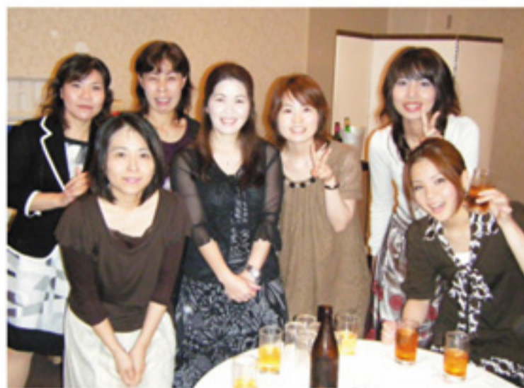
ビールを前にポーズ

今年も那覇西クリニック開院12周年パーティーが5月17日にハーバービューホテルクラウンプラザで開催されました。職員同士や日ごろお世話になっている方々と、ビールやおいしい食事を前に話も弾み、皆の笑顔があふれるパーティーとなりました。