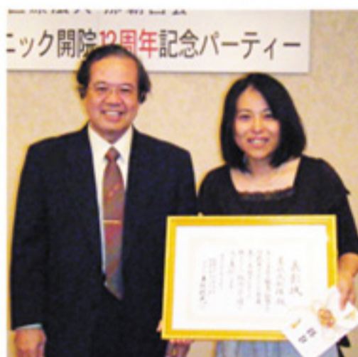
10年勤続功労者の表彰