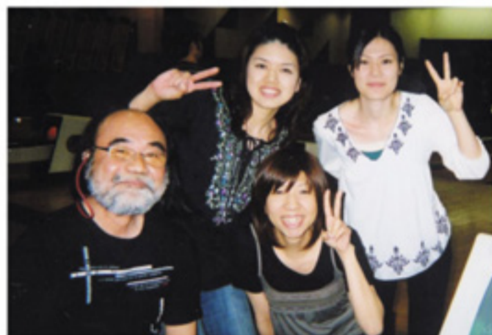
チーム照喜名「がんばるぞ!」