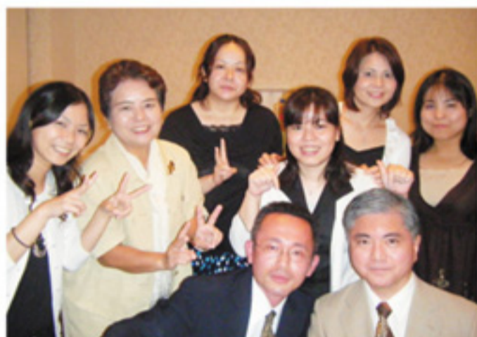
楽しい夜になりました