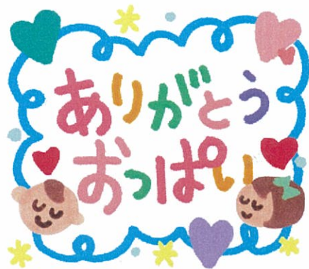
イクコママの乳がん日記 ⑥