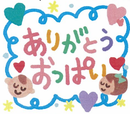
イクコママの乳がん日記 ②